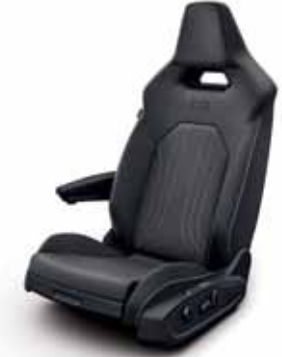
Klädsel textil med röda sömmar/ Leatherette på sidostöd, armstöd och dörrsidor