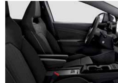
UG Klädsel Alcantara/Leatherette sidostöd, armstöd och dörrsidor (tillval)