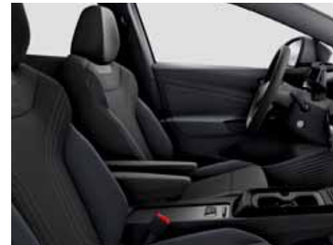
Klädsel Art Velours/Leatherette sidostöd, armstöd och dörrsidor