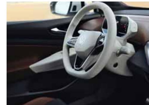
Med Stylepaket och Stylepaket Plus kan man välja vit ratt och vit infotainmentenhet. Ej till GTX.

S Standard T Mot tilläggskostnad - Ej tillgänglig