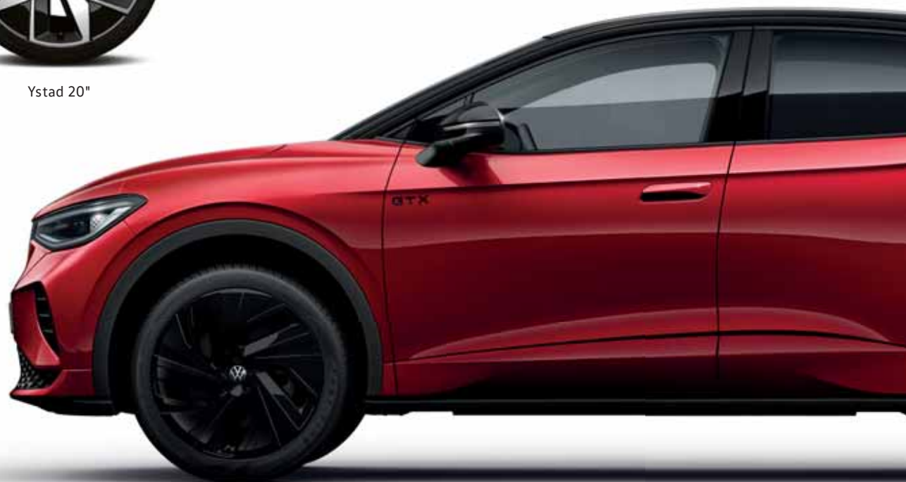
Narvik 21" blanksvarta

S Standard T Mot tilläggs kostnad - Ej tillgänglig