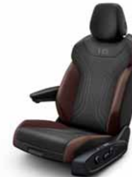
Komfortstol med klädsel Art Velours/ Leatherette på sidostöd, armstöd och dörrsidor