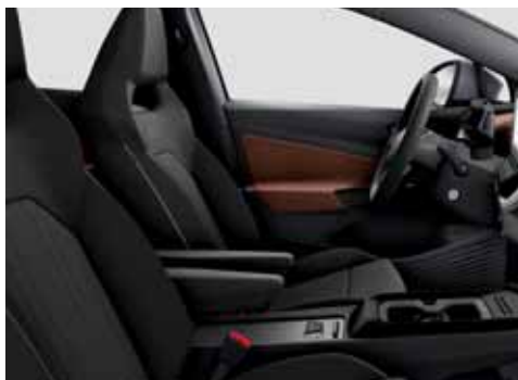
Klädsel Art Velours/Leatherette sidostöd, armstöd och dörrsidor