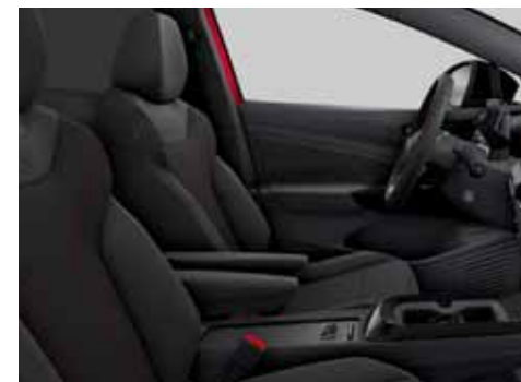
Klädsel Art Velours/Leatherette sidostöd, armstöd och dörrsidor