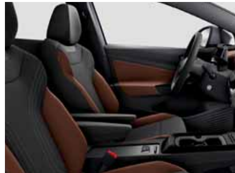
EO Klädsel Art Velours/Leatherette sidostöd, armstöd och dörrsidor