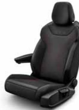
Klädsel textil med röda sömmar/ Leatherette på sidostöd, armstöd och dörrsidor