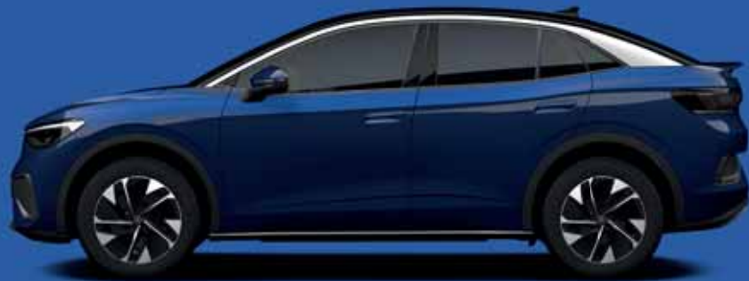
Blue Dusk | T 2 Metallicklack