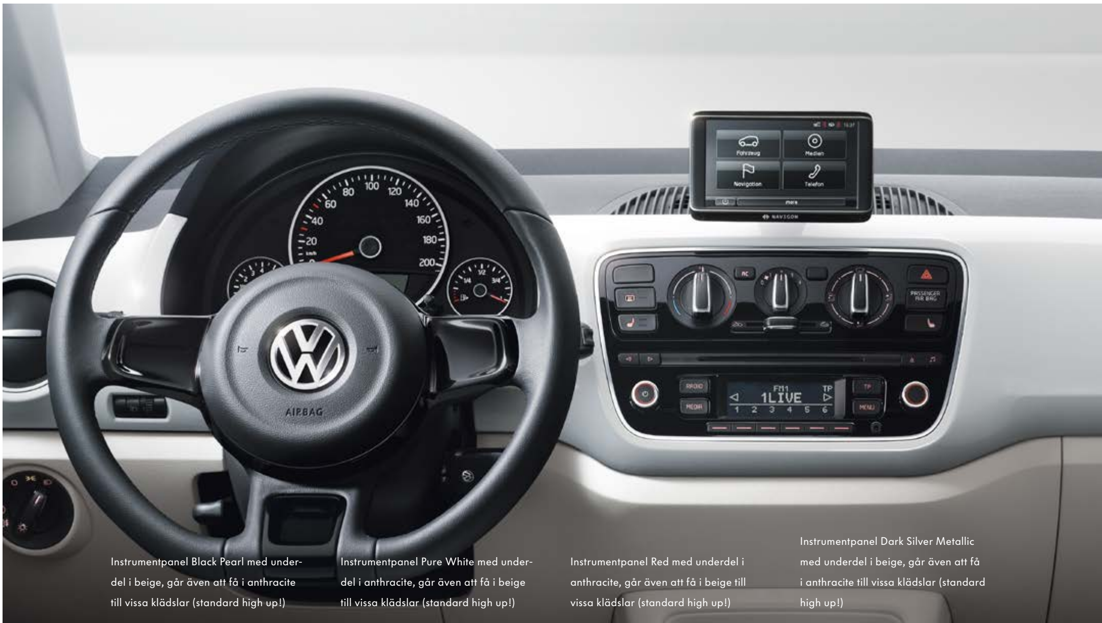
Instrumentpanel Black Pearl med underdel i beige, går även att få i anthracite till vissa klädslar (standard high up!)