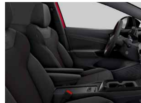
Klädsel Art Velours/Leatherette sidostöd, armstöd och dörrsidor