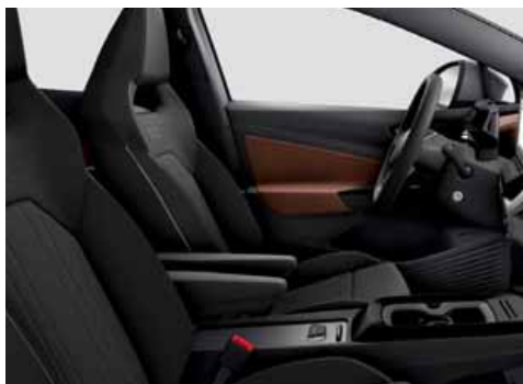
Klädsel Art Velours/Leatherette sidostöd, armstöd och dörrsidor