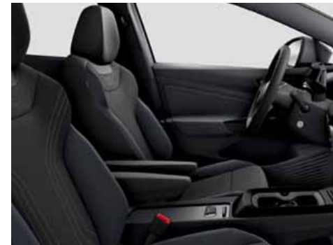
Klädsel Art Velours/Leatherette sidostöd, armstöd och dörrsidor