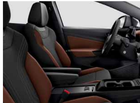
Klädsel Art Velours/Leatherette sidostöd, armstöd och dörrsidor