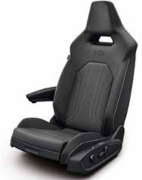
Klädsel textil med röda sömmar/ Leatherette på sidostöd, armstöd och dörrsidor