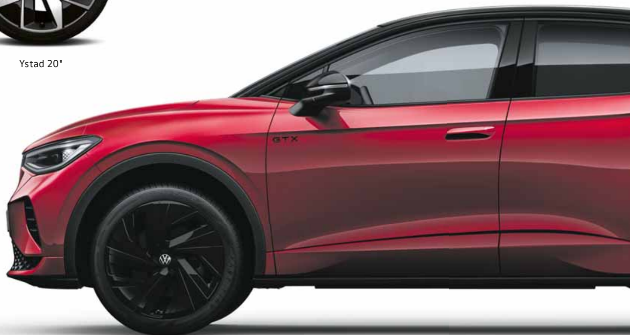
Narvik 21" blanksvarta