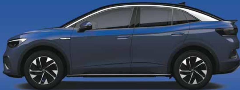
Blue Dusk | T 2 Metallicklack