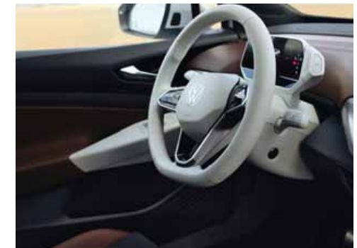
Med Stylepaket och Stylepaket Plus kan man välja vit ratt och vit infotainmentenhet. Ej till GTX.

S Standard T Mot tilläggskostnad - Ej tillgänglig