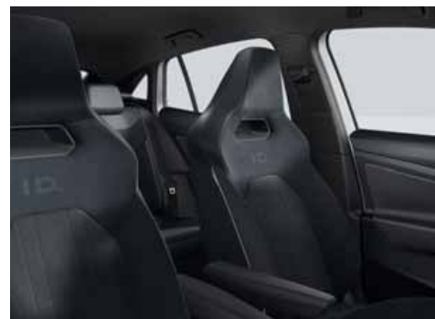
Klädsel Art Velours/Leatherette sidostöd, armstöd och dörrsidor