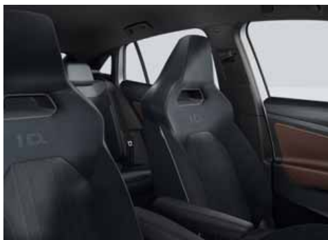
Klädsel Art Velours/Leatherette sidostöd, armstöd och dörrsidor