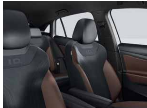
EO Klädsel Art Velours/Leatherette sidostöd, armstöd och dörrsidor