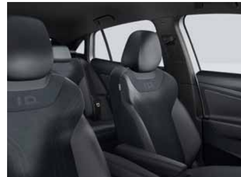
Klädsel Art Velours/Leatherette sidostöd, armstöd och dörrsidor