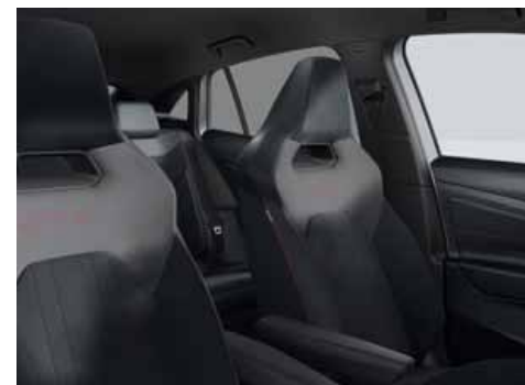
Klädsel Art Velours/Leatherette sidostöd, armstöd och dörrsidor