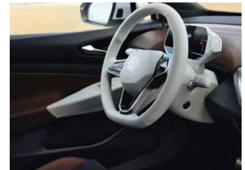
Med Stylepaket och Stylepaket Plus kan man välja vit ratt och vit infotainmentenhet. Ej till GTX.

S Standard T Mot tilläggs kostnad - Ej tillgänglig